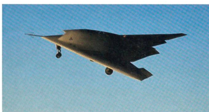
Erstflug der modernen europäischen Drohne Neuron.

Danach ist eine Verlegung ins nord-schwedische Vidslöv vorgesehen. Neuron ist für die Zukunft des Kampfflugzeugbaus in Europa von Bedeutung. Er soll alle Technologien, inklusive Stealth-Eigenschaften, nachweisen. Auch Waffenabwürfe aus dem