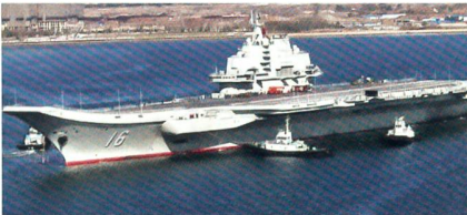
Chinas erster Flugzeugträger «Liaoning».

China hat seinen ersten Flugzeugträger «Liaoning» erfolgreich getestet. Bei einem Manöver ist ein Jagdbomber vom Typ Shenyang J-15 erstmals auf dem Deck des 300 Meter langen Kampfschiffes gelandet, wie die Nachrichtenagentur Xinhua meldete.