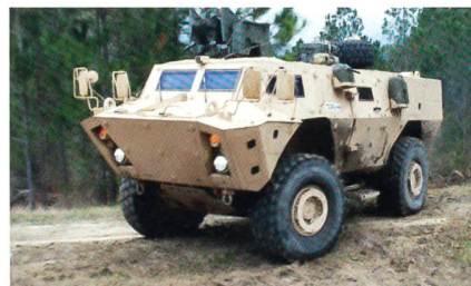
Gepanzertes Patrouillenfahrzeug Textron TAPV der kanadischen Streitkräfte.

Über das Tochterunternehmen Rheinmetall Canada wird der Konzern für die Montage und Prüfung von 500 gepanzerten Patrouillenfahrzeugen des Typs Tactical Armoured Patrol Vehicle (TAPV) des US-Herstellers Textron verantwortlich sein. Der Auftrag hat für Rheinmetall einen Gesamtwert von rund 160 Mio. Euro. Das gesamte Auftragsvolumen umfasst einerseits Ferti-