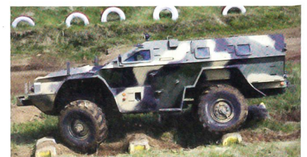
Panzerfahrzeug auf der Basis des KAMAZ-Lastwagens.