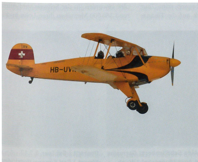
Majestätisch dreht die Bucker ihre Runden über Dübendorf.