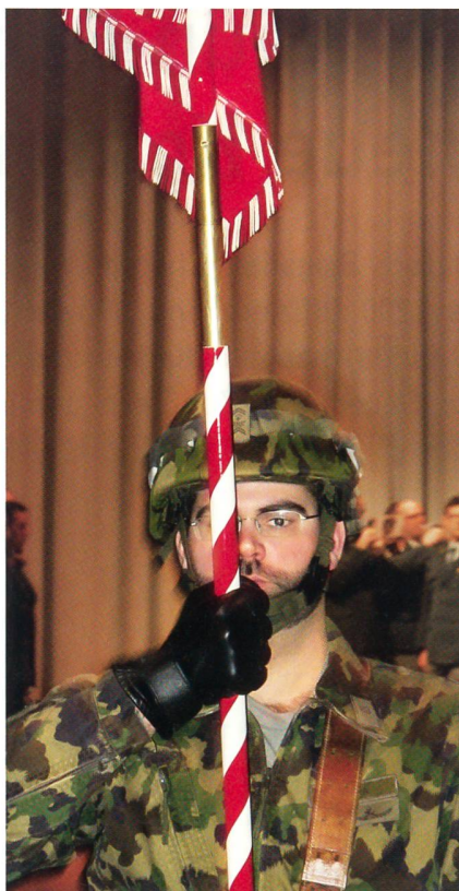
Der Einmarsch der Feldzeichen.

In seinem Rückblick bezeichnete Brigadier Kaiser das Jahr 2012 als arbeitsreich: «Im Vordergrund standen nebst der Ausbildung weit über 1000 grössere und kleinere Einsätze. Diese reichten vom WEF über die