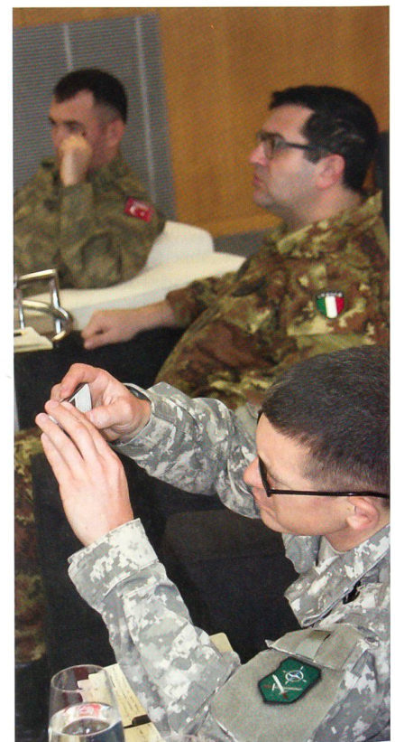
Drei Stabsoffiziere aus drei Nationen: O'Reilly, Minghetti, Basbug.