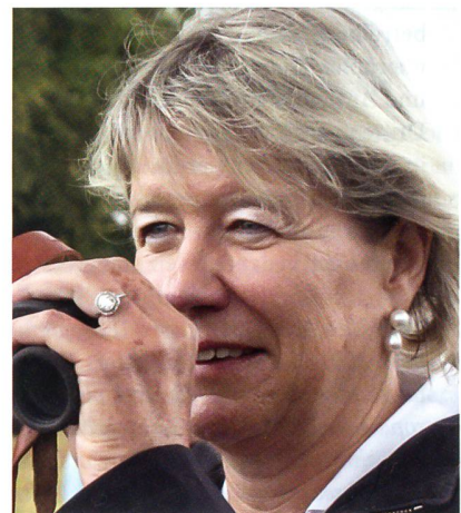
Die Aargauer Nationalrätin Corina Eichenberger kämpft für die Armee.

Für die SiK-Mehrheit sprach die Aargauerin Eichenberger, seit langem eine starke Stütze der Landesverteidigung. Sie traf den Nagel auf den Kopf, als sie festhielt: «Die Kommissionsmehrheit will auf keinen Fall, dass das Heer gegen die Luftwaffe ausgespielt wird. Die Beseitigung der Ausrüstungslücken muss weiter angestrebt werden.»