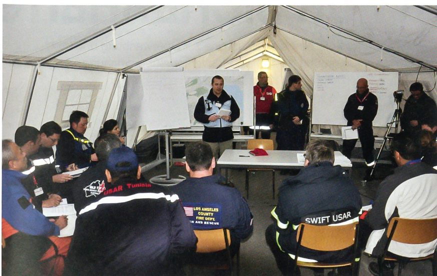
Im OSOCC-Zelt (On-site Operations Coordination Center, Koordinationszentrum).

vornehmen. Anschliessend erfolgte die gestaffelte Verschiebung in der Luft und auf der Strasse ins Einsatzgebiet in Kriens.