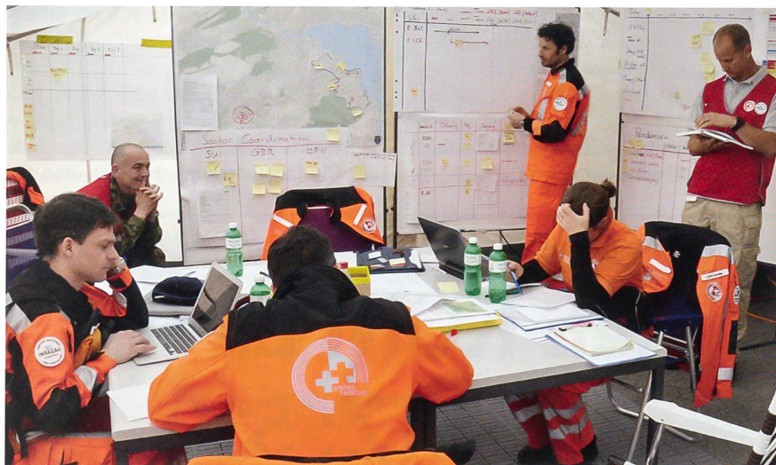
Das Schweizer Team mit den beiden Coaches (rote Westen) an der Führungswand.