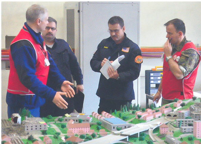
Ein Teil des amerikanischen Teams bespricht mit den Coaches die kurze Entschlussfassungsübung am Geländemodell.

Der interkulturelle Austausch nimmt anlässlich einer solchen Übung einen sehr