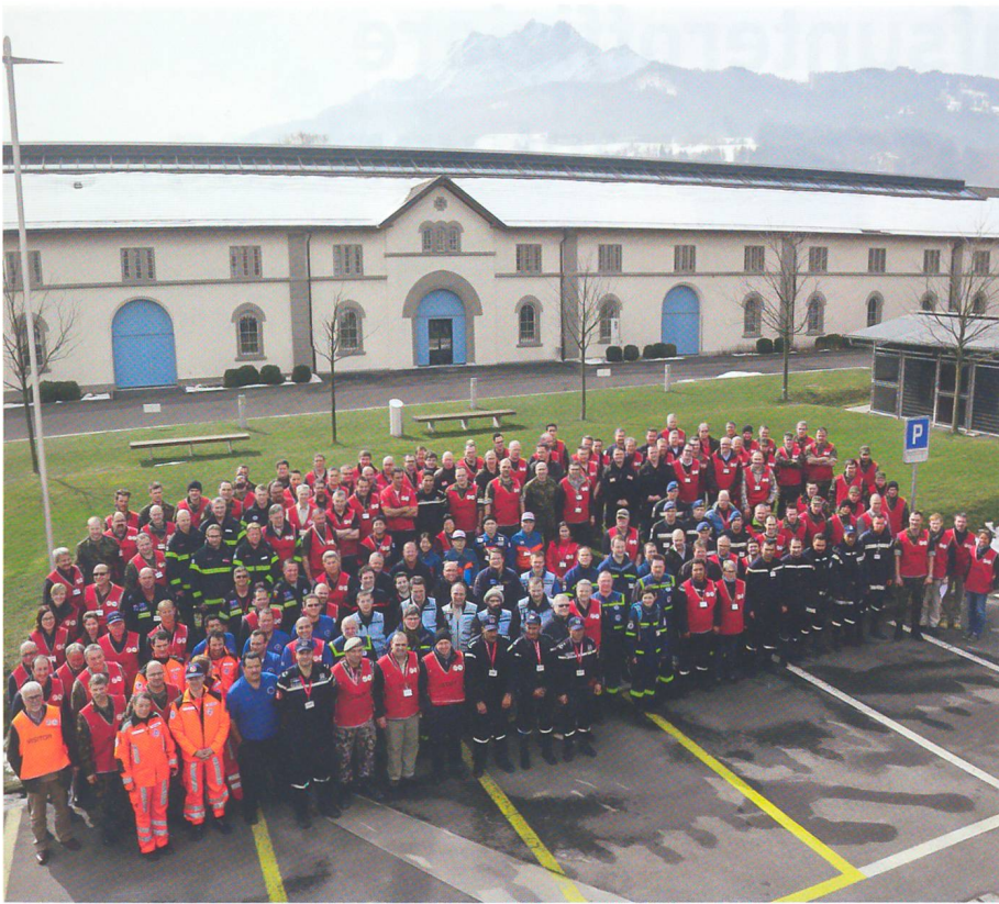
Teilnehmer und Übungsleitung in der Generalstabsschule Kriens mit dem Pilatus.

Teams traten am anderen Morgen früh den Heimweg rund um den Globus wieder an.