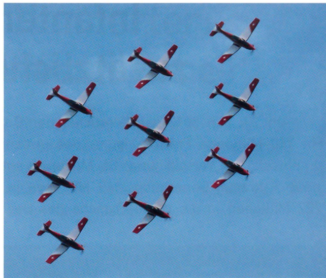
Das PC-7-Team mit der Figur Flying Diamond über Emmen.