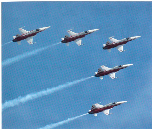
Die Patrouille Suisse in der Formation Pfeil.