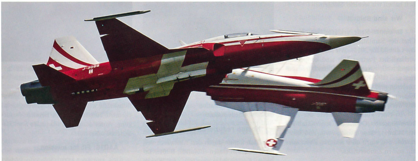
Spektakuläre Kreuzung der Patrouille-Suisse-Solisten bei der Präsentation in Emmen.