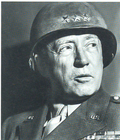
Generalleutnant George Patton kommandierte die amerikanische 8. Armee.