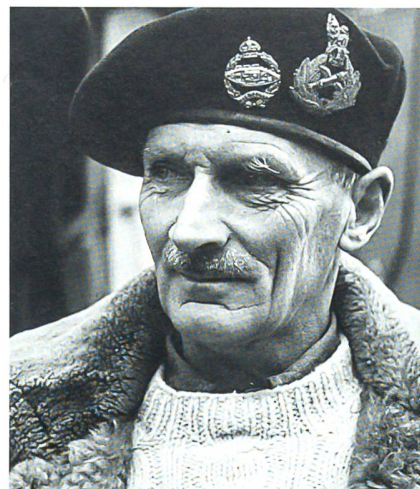
General (später Feldmarschall) Montgomery führte die britische 7. Armee.