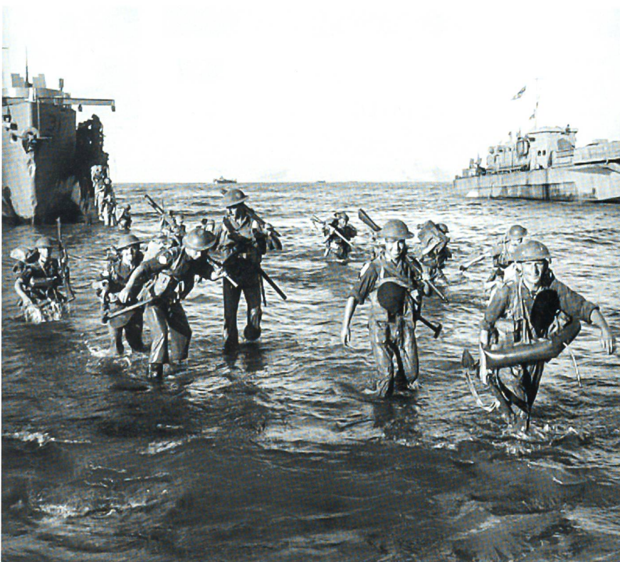
10. Juli 1943, Operation «HUSKY»: Die alliierte Landung an der Südküste von Sizilien.