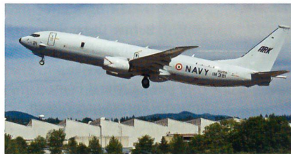
Erstflug der P-8I.

Der erste Boeing P-8I Poseidon für Indien ist auf dem indischen Marinestützpunkt Arakkonam gelandet. Indiens Regierung hat bei Boeing im Januar 2009 acht P-8I Seeaufklärer und U-Bootjagdflugzeuge in Auftrag gegeben. Der Kaufvertrag wurde auf einen Wert von 2,1 Milliarden beziffert. Die zweite und dritte Maschine sollen jeweils im August und November 2013 ausgeliefert werden. Die übrigen fünf Flugzeuge sollen bis Ende 2015 schrittweise folgen.