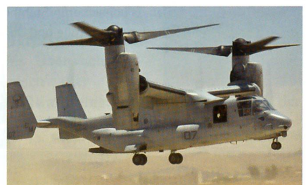
Der MV-22 Osprey der U.S. Marines.