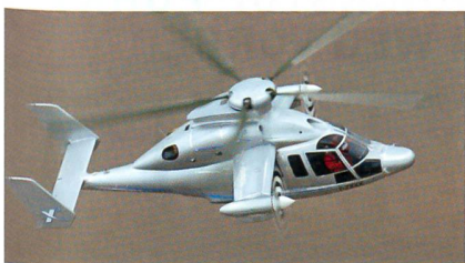
Eurocopters «Rekordmaschine», der Hybridhelikopter X3.

Wenige Tage zuvor erreichte der X3 im Sinkflug die Geschwindigkeit von 263 Knoten (487 km/h). Der Eurocopter X3 erzielte den Meilenstein von 255 Knoten während eines Testflugs von 40 Minuten in einer Höhe von 3000 Metern. Der X3 verfügt über zwei RTM322-Triebwerke, die einen Fünf-