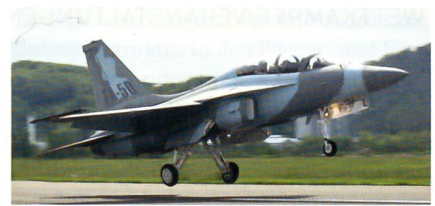
Leichtes Kampfflugzeug FA-50.

Korean Aerospace Industries (KAI) gab kürzlich einen Grossauftrag für weitere FA-50-Kampfflugzeuge bekannt. Die Maschinen sind für die koreanischen Luftstreitkräfte bestimmt. Der Auftrag entspricht nach Angaben von KAI einem Wert von rund einer Milliarde US-Dollar, die Stückzahlen wurden dabei nicht kommuniziert.