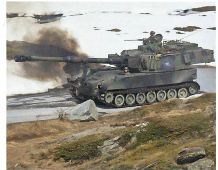
Vom Bereitschaftsraum zur Feuerstellung.

Es wird auch für die taktische und logistische Planung und Führung der Verbände der Artillerie innerhalb eines Grossen Verbandes oder einer Kampfgruppe eingesetzt. INTAFF ist in sich geschlossen und wird als Fachsystem Artillerie bezeich-