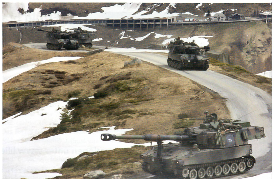
Verschiebung der Panzerhaubitzenbatterie 54/1.

Mit dem für schwere Panzerfahrzeuge eigenen Geräusch von sich im kalten Teer vorwärtsgreifenden Ketten, quietschenden Antriebs- und Spannrädern und dem Gedröhne der mehreren hundert PS starken Dieselmotoren ziehen sie unter leichtem Vibrieren der Strasse ihre Spuren über den Pass.