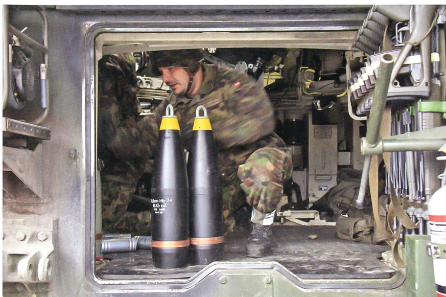
Das Verstauen der Munition in der Panzerhaubitze ist Knochenarbeit.