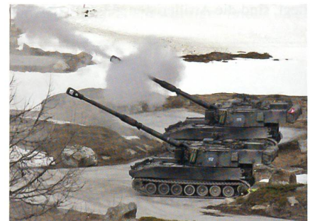
Zwei Geschütze beim Feuern.