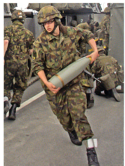
Eine Stahlgranate wiegt 43 kg.