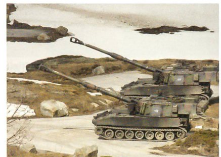
Zwei Haubitzen feuerbereit.