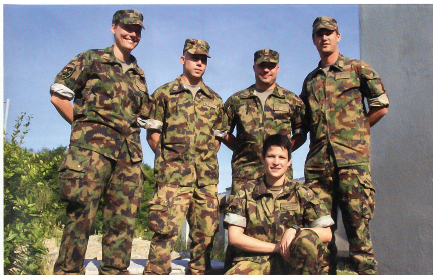
Die fünf Kompaniekommandanten des Katastrophenhilfebataillons 4.

Im Kata Hi Bat 4 werden die Stabskp und die Rttg Kp 4/1 von Frauen geführt, die Rttg Kp 4/2 und 4/3 sowie die Bau Sap Kp 4/4 von Männern.