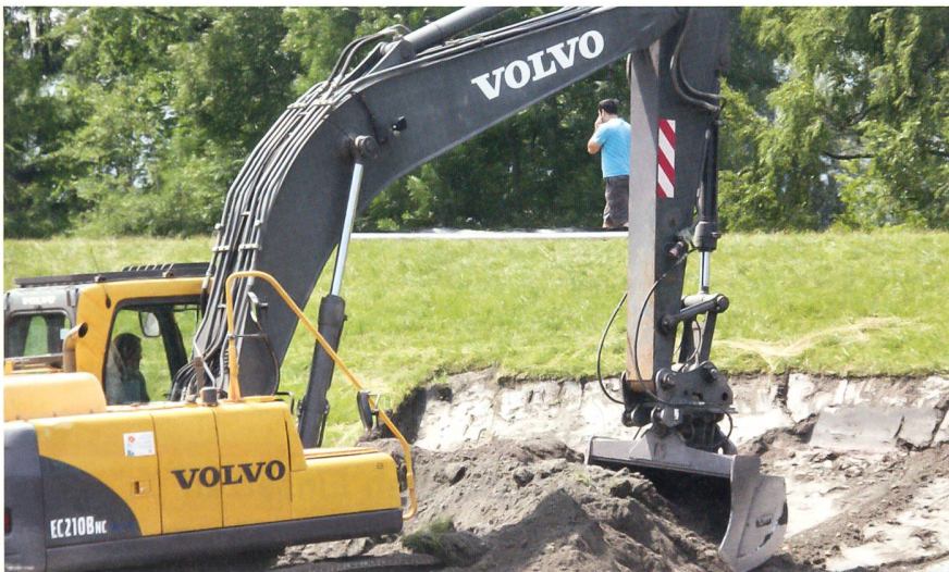
Die spektakuläre Errichtung des Auflastfilters am bedrohten Rheindamm bei Ruggell.