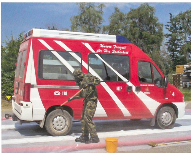
Dekontamination des Feuerwehrfahrzeuges von Ruggell.