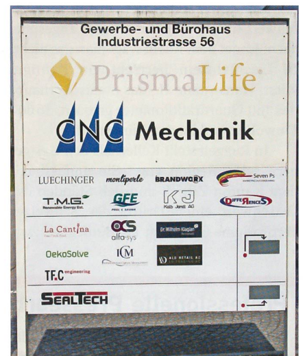
Gefährdet ist die lokale Industriezone.