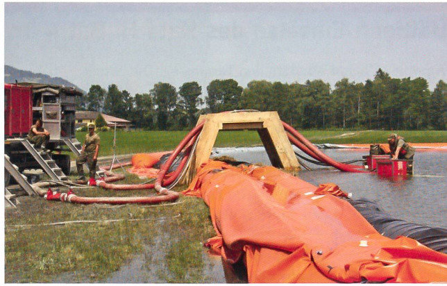
Das riesige Entlastungsbecken fasst 300 000 Liter. Es fängt Abwasser auf, bindet dieses und leitet es in den Rhein weiter.