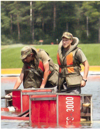
Zwei Soldaten der Rttg Kp 1/4 stehen im Entlastungsbecken.