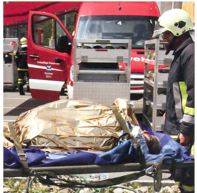
Trotz der Hitze gut zugedeckt und geschützt: ein Brandopfer.