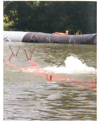
Von den Vorflutern im Lande kommt Wasser in das Becken.