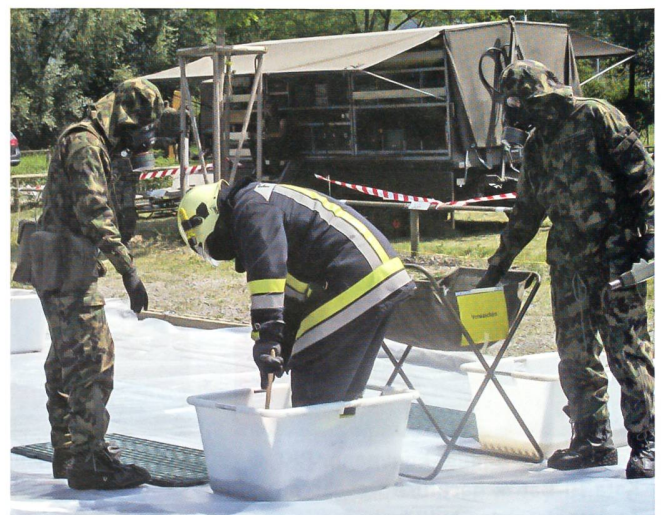
Ein Feuerwehrmann wird gereinigt. Die Helden im C-Vollanzug.