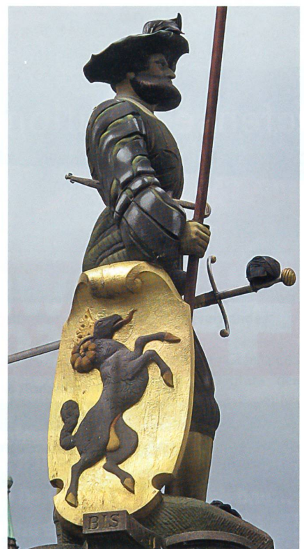
Seit Jahrhunderten überragt der Landsknecht den Schaffhauser Fronwagplatz.