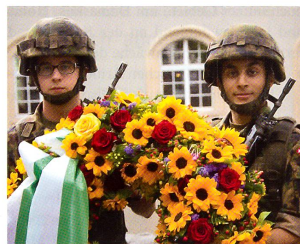
Unteroffiziere mit Blumenkranz.