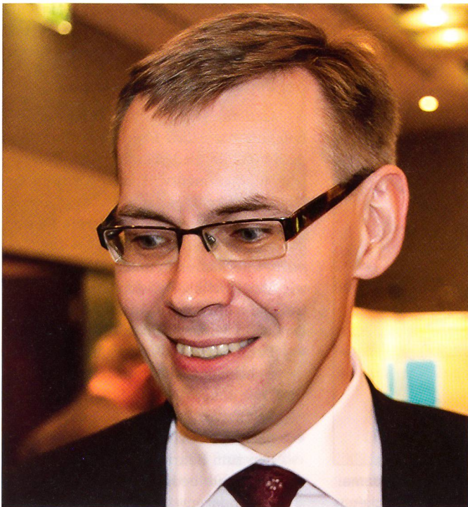
Andrius Krivas, der 43-jährige Vize-Aussenminister Litauens.