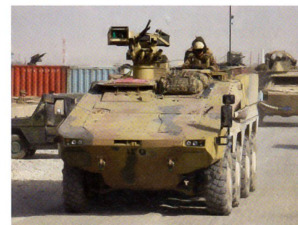
Schützenpanzer Boxer in Afghanistan.

Die Verteidigungspolitiker setzen sich zudem dafür ein, auch 2015 moderne persönliche Ausrüstung für die Soldaten der Kampftruppen zu beschaffen. Zum System Infanterist der Zukunft gehören unter