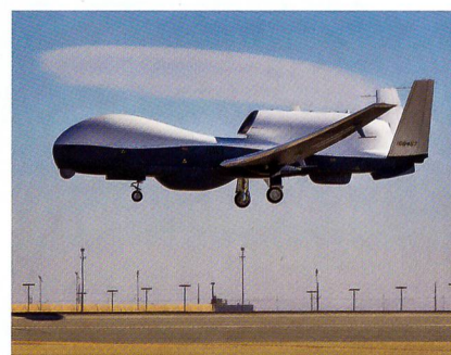
Die Drohne MQ-4C Triton im Testflug.

Viele Parlamentarier sind darüber – gelinde gesagt – unglücklich. Alle wesentlichen Entscheidungen würden immer vorher an die Medien durchgestochen, ob verstärkter Irak-Einsatz, Ukraine-Einsatz von Aufklärungsdrohnen, die Ergebnisse der Wirtschaftsprüfer zu Rüstungsprojekten und jetzt eben die Planung der Triton .