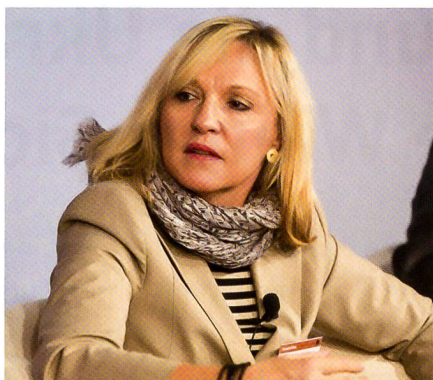
Beate Merk, Staatsministerin von Bayern.

Es bleiben 12 000 alliierte Soldaten. Diese verschwinden in der Fläche (652 225 km 2 ). Die Taliban sind erstarkt. Positiv