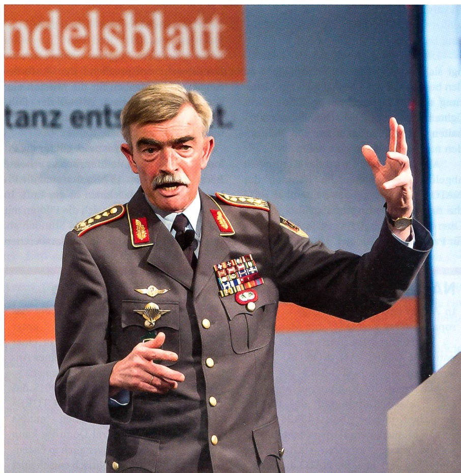
General Domröse, wie er lebt und lebt: «ein Freund der klaren Aussprache».