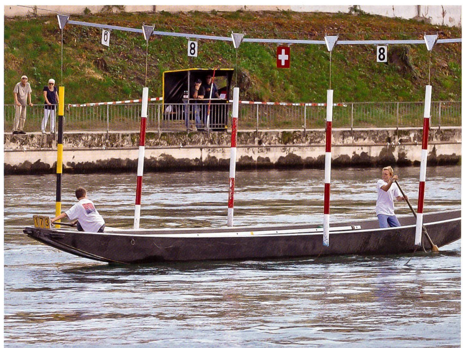
Jungpontoniere auf der Aare im Einsatz.