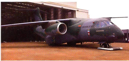
Roll-out des KC-390.

Der zweistrahlige Militärtransporter wird im Embraer Werk in Gavião Peixoto gebaut, das rund 200 Kilometer westlich von São Paulo liegt. Nach der Feier wird der mittelschwere Transporter nun für den Erstflug vorbereitet, nach Aussagen von Embraer soll der neue Jet noch in diesem Jahr abheben. Für das Flugtestprogramm sind insgesamt zwei Prototypen geplant,