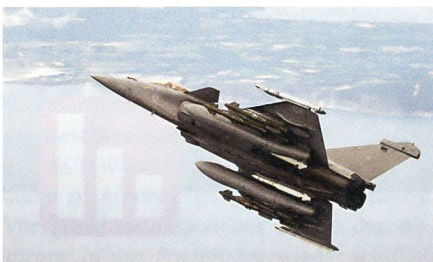
Mehrzweckkampfflugzeug Rafale M F3.

Anfang 2012 wurde Dassault mit der Aufrüstung von zehn älteren Rafale M aus dem F1 Standard auf den F3 Standard beauftragt, diese Maschinen wurden um die Jahrtausendwende an die Marine Frankreichs ausgeliefert und waren nicht mehrrollenfähig. Bis 2017 sollen die ersten zehn Rafale