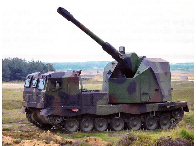
Das deutsche Geschütz DONAR von Krauss Maffei Wegmann. Es ist eine Weiterentwicklung der Panzerhaubitze 2000.