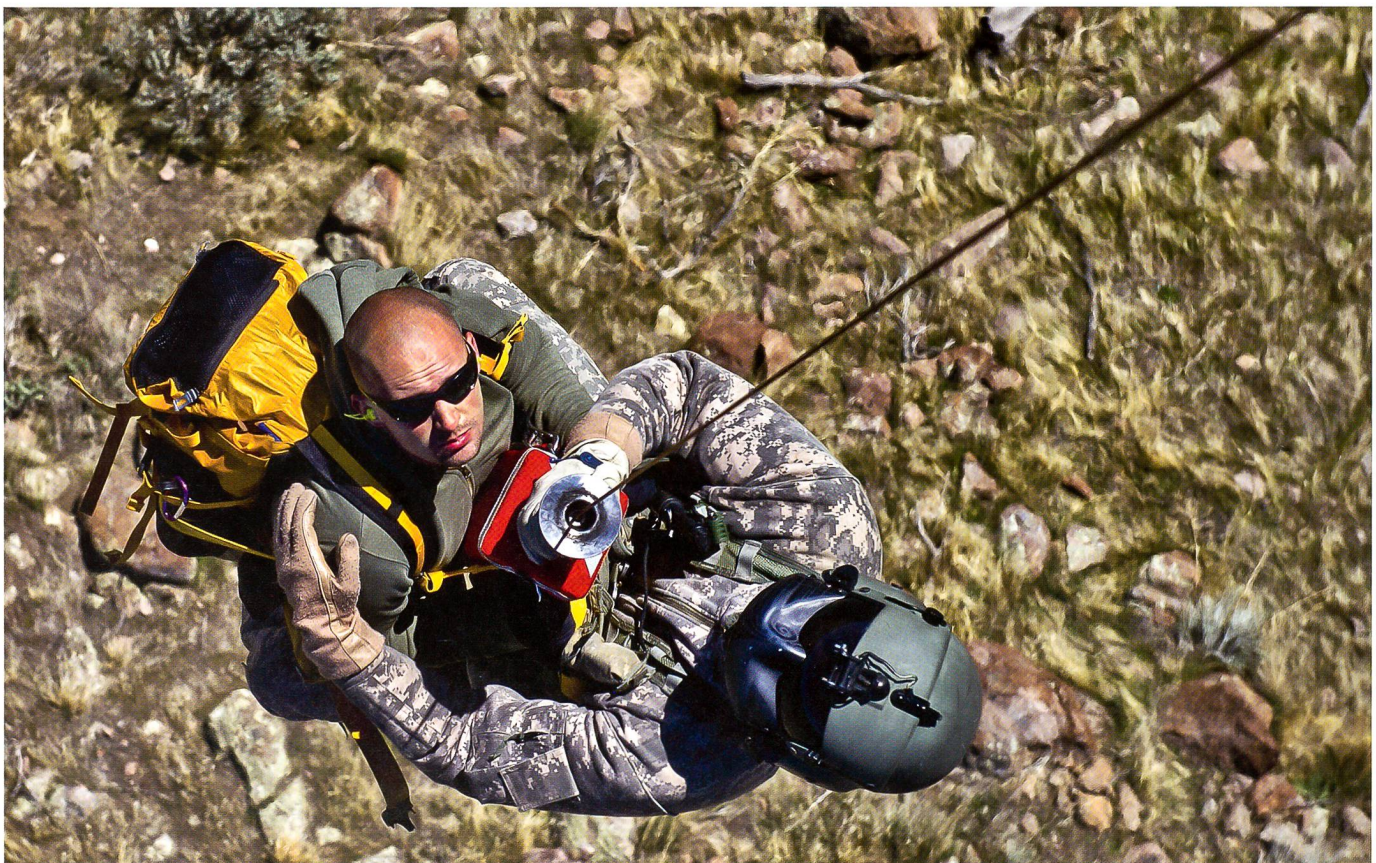
Ein amerikanischer Soldat rettet einen Zivilisten in höchster Not.

Bruno Lezzi gehört zu den erfahrensten Militärpublizisten der Schweiz. An der Universität Zürich leitet er erfolgreiche Veranstaltungen zu strategischen Themen. Der vorliegende Beitrag entstand in Fort Benning (Georgia, USA) und ist ein leicht ergänzter Nachdruck aus der «Neuen Zürcher Zeitung».