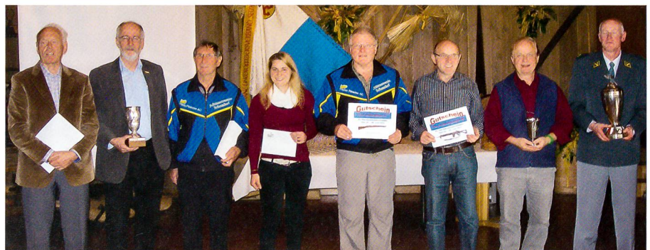
Die Gewinner des Sempacherschessens 2013.