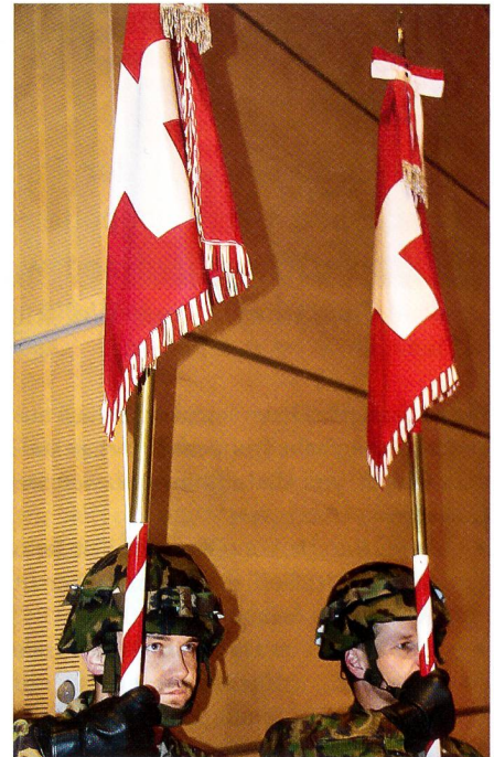
Zwei stolze Fähnriche, zwei Standarten.

Schellenberg: «Der Chef der Armee hat die Sistierung des Vorhabens offiziell aufgehoben. Es geht darum, dass wir über eine Luftwaffe verfügen, die 24 Stunden am Tag, 7 Tage in der Woche und 365 Tage im Jahr einsatzbereit ist. Daran arbeiten wir intensiv, und wir werden dieses hochgesteckte Ziel gemeinsam erreichen.»