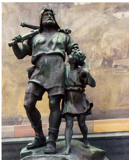
Wilhelm Tell. Das Denkmal in Altdorf.

Alle drei standen für eidgenössische Tugenden: Arnold von Winkelried der opferbereite Held, der das Gesamtwohl über die eigenen Interessen stellt; Wilhelm Tell, der freiheitsdurstige Held und Kunstschütze, der durch Schiller unsterblich geworden ist, und Niklaus von Flüe, der weise Friedensstifter und legendäre Schöpfer des Gedankens der Schweizer Neutralität.