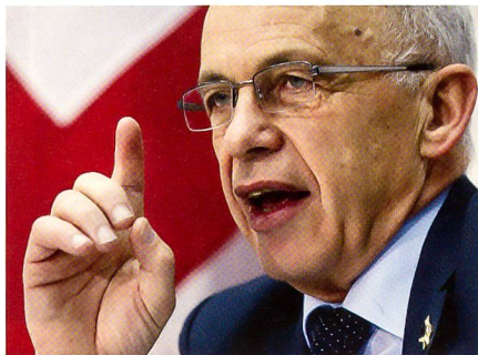
Ueli Maurer: Vorwürfe sind zynisch.

Wir leiden an hohen Betriebskosten, und selbst mit dem neuen Armeeplafond