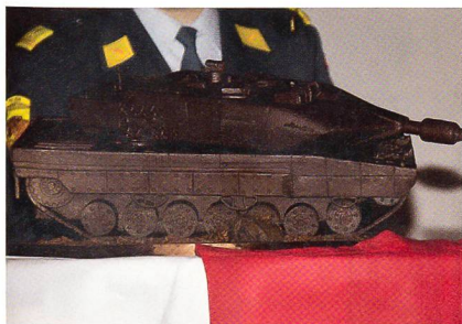
Masstabgetreu: Der Schoggi-Panzer.

Die OG Panzer wäre nicht die OG Panzer, warte sie nicht jedes Jahr mit einer Überraschung auf.