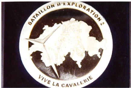
Die Medaille des Aufkl Bat 2.

Zum Schluss seiner Kommandojahre schrieb Oberstlt i Gst Häsler der Redaktion des SCHWEIZER SOLDAT einen persön-