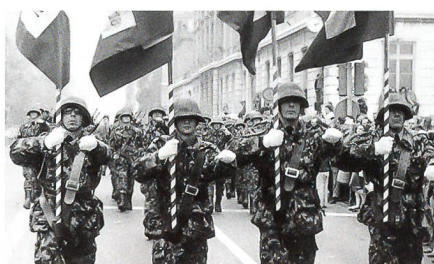
Fähnriche mit weissen Handschuhen.

Ein Bild zeigt die Fähnriche und die Fahnen der vier Bataillone, die zu Beginn