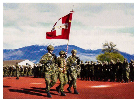
In der Walliser Ortschaft Savièse oberhalb der Kantonshauptstadt Sion wird die Fahne des Gebirgsinfanteriebataillons 29 stolz präsentiert.