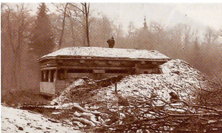
Le poste d'observation Nord (1915).

Cette belle affluence montre qu'en Ajoie, l'époque de la Grande Guerre intéresse le public, peut-être plus qu'ailleurs en