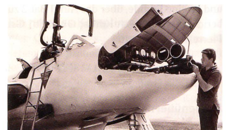
In der dritten Dimension.

Eine der grossen «Sensationen» der Expo '64 war eine neue Technologie, mit der man erstmals Filme in einem 360-Grad-Panorama-Format zeigen konnte. Gleich