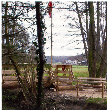
La passerelle sur La Largue.

Depuis 1915, les Allemands bétonnaient systématiquement leurs fortins. Il en reste de nombreux vestiges dans le secteur. Les Français se contentaient de fortifica-