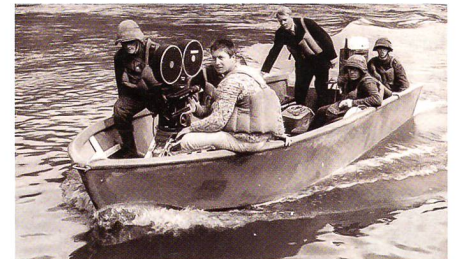
In Kooperation mit der Armee.

Am 12. und 13. September 2014 präsentiert Memoriam im Rahmen von «50 Jahre Expo '64» einzigartige audiovisuelle Schätze die-