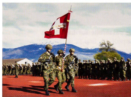
In der Walliser Ortschaft Savièse oberhalb der Kantonshauptstadt Sion wird die Fahne des Gebirgsinfanteriebataillons 29 stolz präsentiert.