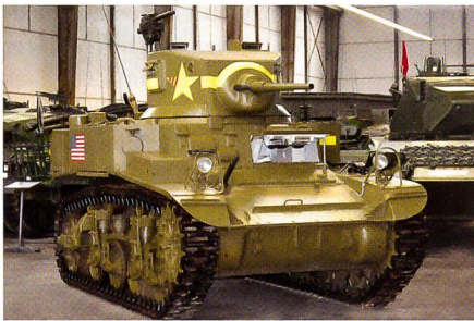
Amerikanischer Leichtpanzer Stuart M3A1 aus dem Jahr 1942, eingesetzt in Tunesien 1942/43.

Gezeigt wird nicht nur die praktisch lückenlose Reihe von Schweizer Kampf- und Schützenpanzern vom Panzerwagen 39 vom Beginn des Zweiten Weltkrieges bis zum Panzer 68/88, dem letzten als Schwei-