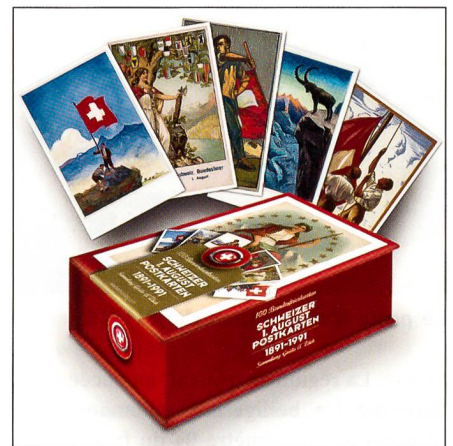
Hundert Postkarten zur Bundesfeier.

Am 1. August 1891 fand die erste schweizerische Bundesfeier statt; 600 Jahre nach Abschluss des im Bundesbrief von 1291 durch die Urkantone Uri, Schwyz und Unterwalden besiegelten Bündnisses.