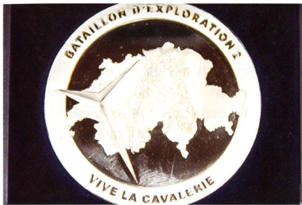
Die Medaille des Aufkl Bat 2.

Zum Schluss seiner Kommandojahre schrieb Oberstlt i Gst Häsler der Redaktion des SCHWEIZER SOLDAT einen persön-