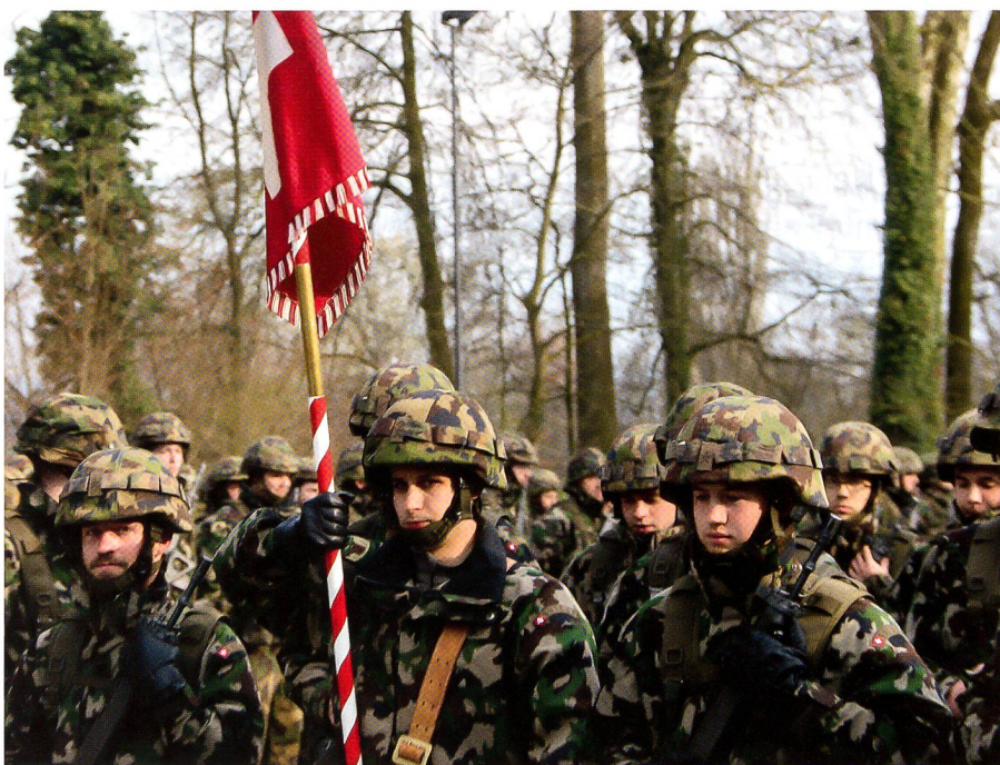
Das Feldzeichen als Symbol des militärischen Verbandes als Schicksalsgemeinschaft.