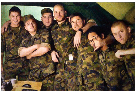
Auch das gehört dazu: Gute Stimmung.