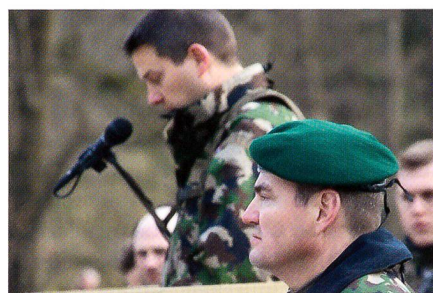
Brigade- und Bataillonskommandant.