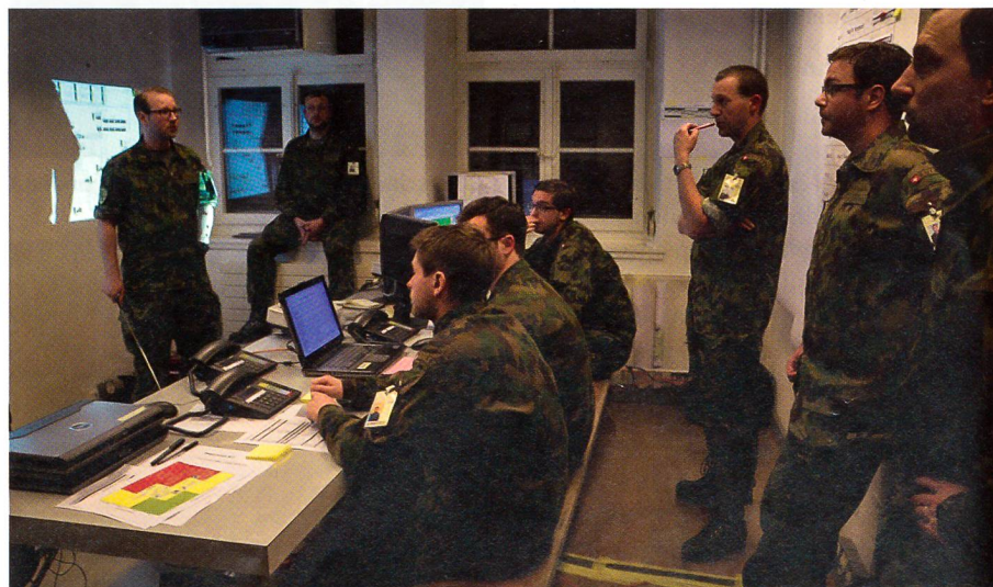
Vorbildliche Einsatzstelle des FU Bat 9 an der Volltruppenübung «MAGADINO». malim