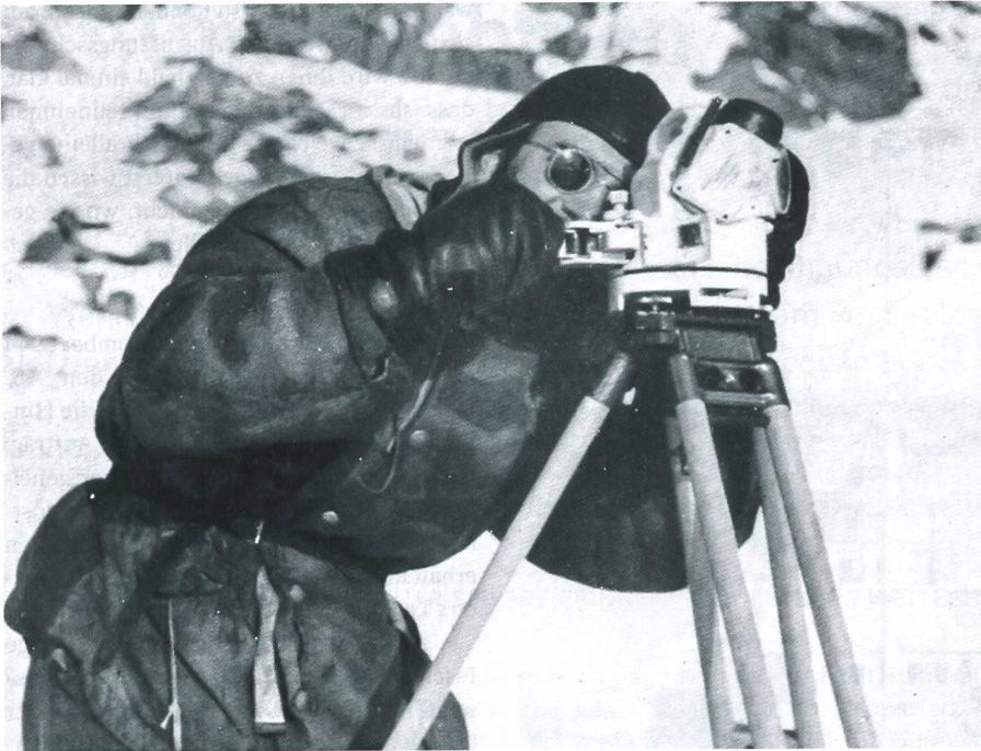
Der Wetterballon wird vom Wetterteam mit einem Theodoliten verfolgt.

Versuch soll schnellstmöglich angegangen werden, denn die Zeit drängt. Die Wetterstation muss vor dem Beginn des arktischen Winters mit der Übermittlung der Wetterdaten beginnen.