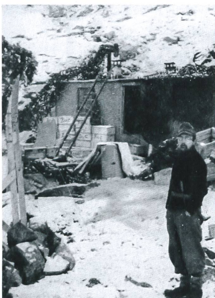
Die Station zu Beginn des Unternehmens.

Der Wettertrupp wird mit Material und reichlich Verpflegung (etwa 6000 Kalorien pro Mann/pro Tag) für rund 18 Monate ausgestattet. Die Menge an Versorgungsgütern ist so gross und umfangreich, dass die Autonomie der Station ohne Einschränkung auf