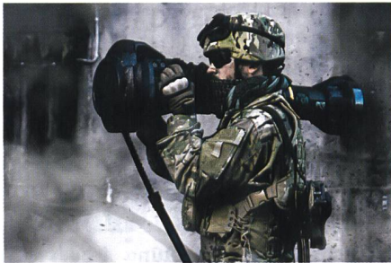
Abschuss einer Panzerabwehrrakete.

Die finnischen Streitkräfte beschaffen weitere Saab-Panzerabwehrhandwaffen. Sie bestellten für rund 32 Millionen Euro eine weitere Tranche der Next Generation Light Anti-tank Weapon (NLAW). Der Vertrag umfasst neben den Waffen auch Ausbildungsgeräte sowie Optionen für weitere Lieferungen. Das ursprünglich für Grossbritannien entwickelte schultergestützte Panzerabwehrraketensystem NLAW hat