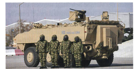
ABC-Aufklärungsfahrzeug Pars von FNSS.

Das türkische Rüstungsunternehmen FNSS Savunma Sistemleri hat neue Varianten der gepanzerten Radfahrzeugfamilie Pars vorgestellt. Auf dem 6×6-Laufwerk wurde ein ABC-Aufklärungsfahrzeug mit Sensoren und Analysegeräten für die Detektion und Identifikation chemischer Kampfstoffe, toxischer Industriechemikalien und biologi-