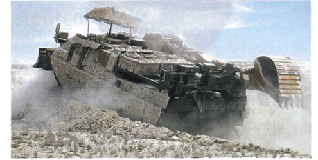
Bergepanzer WiSENT 2 im Einsatz.

Die norwegische Beschaffungsbehörde hat sechs WiSENT 2 Bergepanzer bei der FFG Flensburger Fahrzeugbau Gesellschaft mbH zur Auslieferung ab 2017 bestellt. Die Bestel-