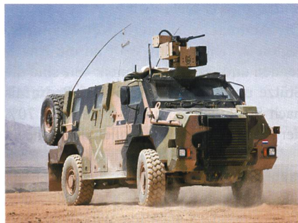
THALES Bushmaster mit fernbedienter Waffenstein für die Niederlande.

Die Niederlande haben bei THALES Australien zwölf neue geschützte Fahrzeuge des Typs Bushmaster bestellt. Die Fahrzeuge sollen in der Variante Truppentransporter ausgeliefert werden und verfügen über eine zusätzliche Kompositpanzerung, fernge-