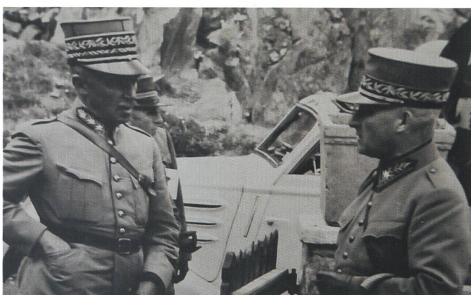
General Guisan inspiziert im Zweiten Weltkrieg das Reduit.