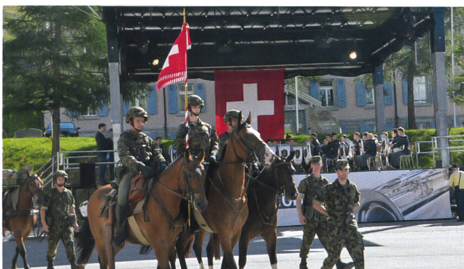
Das Feldzeichen: Auftakt mit berittener Standartenabordnung.