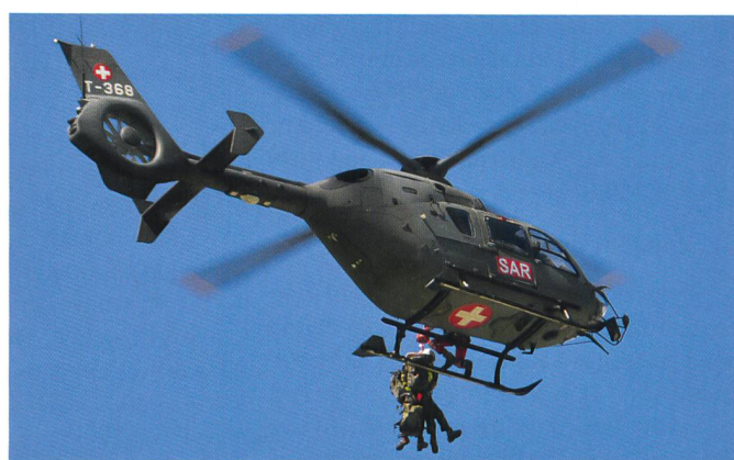
Spektakuläre Bergrettung mit dem Armeehelikopter T-368.