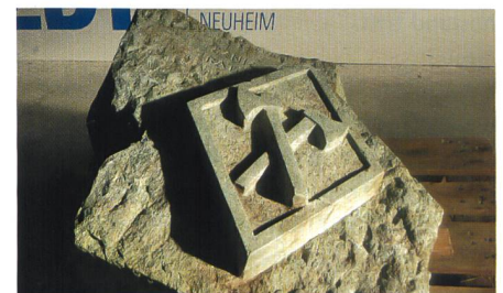
Im Depot. Links oben die Inschrift.

Bis Klarheit herrscht, bleibt die Platte im Depot aufbewahrt. Hinweise nimmt Lorenz Strickler gerne entgegen: Telefon: 079 662 35 06 oder per Mail: lorenz@strickler-werkzeuge.ch Andreas Hess