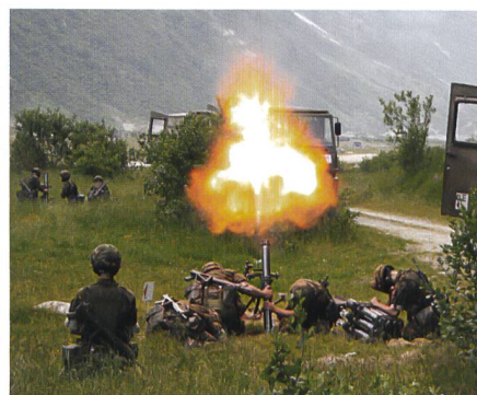
Wir gehen näher ran: Das Geb Inf Bat 77 im WK