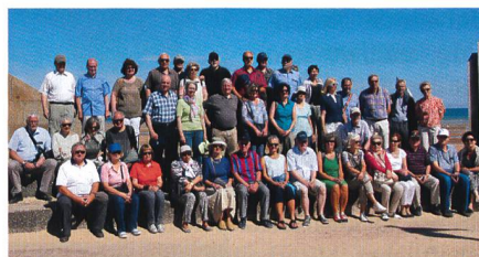
Der VEZ in der Normandie 2015.