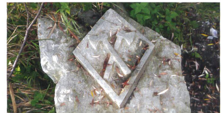
Der Fund. Die Inschrift ist noch verdeckt.