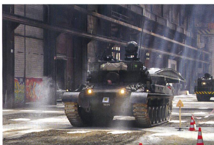
Ein Pz 68 kehrt am Panzertag 2015 zurück in die Geburtsstätte Stahlgesserei.

Am Jubiläumsanlass vom 5. September 2015, mit Auftritt von KKdt Blattmann, nahmen zahlreiche Freunde des Museums teil. Der Anlass war ein voller Erfolg.