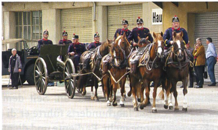
1. Weltkrieg: Sechsspännige Artillerie.

Daraus ist in den vergangenen 10 Jahren ein Museum entstanden, welches die Entwicklung der Ausrüstung und Bewaffnung der Schweizer Armee zeigt und somit einen Teil der schweizerischen (Technik-)Geschichte beleuchtet. So wurde aus einer