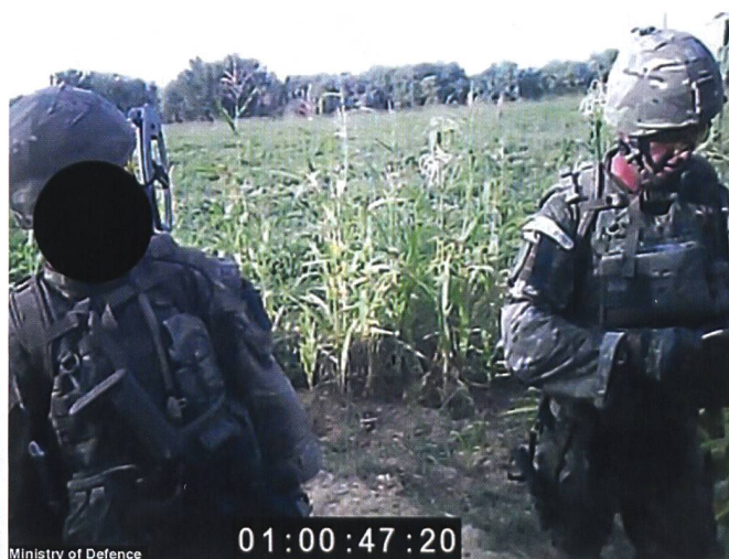
Nochmals das Video, das Blackman zum Verhängnis wurde; aufgenommen noch vor dem Vorfall mit dem Taliban. Der Royal Marine links wurde freigesprochen. Sein Gesicht ist geschwärzt.