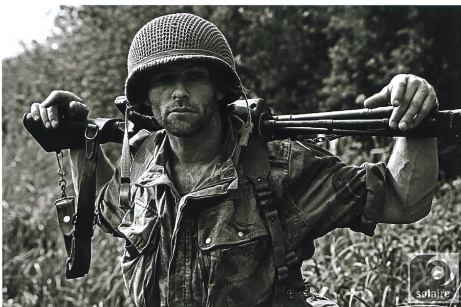
Ein französischer Soldat in Dien Bien Phu 1954.

Eine militärische Auseinandersetzung zwischen Nordvietnam und den USA war nur noch eine Frage der Zeit. ☒