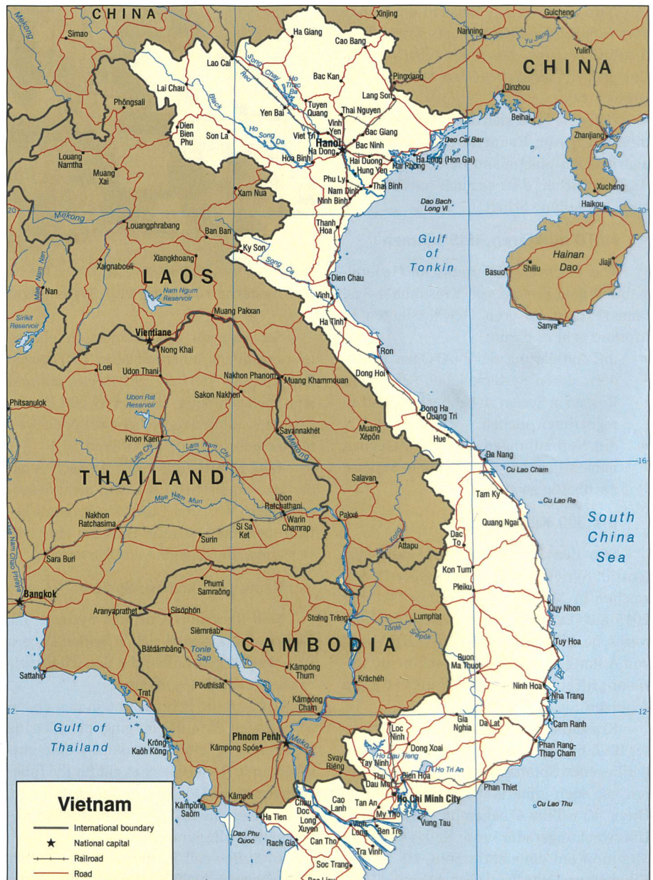
Die Karte des heutigen Vietnam: Nördlich von Quang Tri verläuft der 17. Breitengrad, welcher Nord- und Südviets von 1954 bis 1975 teilte.

Dort ernannte er sich zum Kaiser von Nam Viet, einem Gebiet, das bis zum heu-