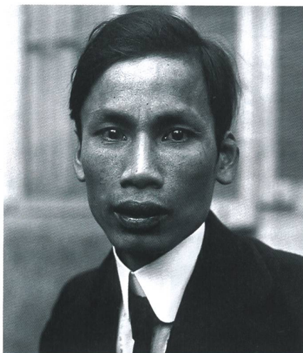
Der junge Ho Chi Minh 1921 in Paris. Bevor er 1941 nach Vietnam zurückkehrte, war er fast 30 Jahre im Ausland.

Während der junge Ho Chi Minh ab 1913 die USA bereiste, dann in London und anschliessend sechs Jahre in Paris arbeitete, wurden im 1. Weltkrieg 100 000 Vietnamesen als Arbeitskräfte und Soldaten nach Frankreich geholt. In Paris machte sich Ho einen Namen als Journalist und Autor, der vor allem gegen den Kolonialismus schrieb,