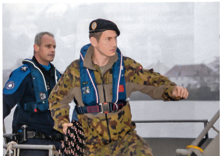
Gleich legt das patrouillierende P80-Boot an.