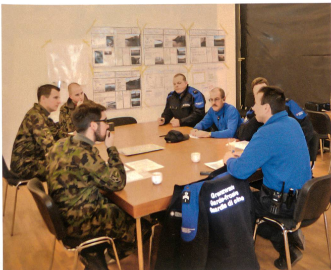
Grenzwehr und Armee: Rapport im Einsatz «ALCEO».