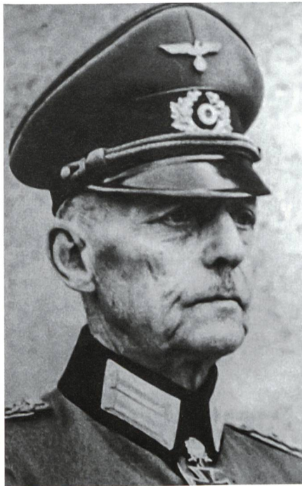
Feldmarschall Karl Rudolf Gerd von Rundstedt, Oberbefehlshaber West.