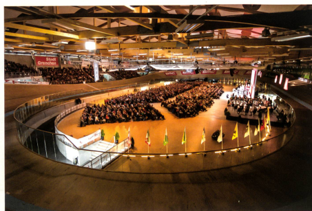
Das Velodrome von Grenchen – eine imposante Kulisse.