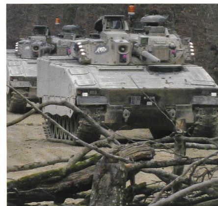
Die OG Panzer mit neuer Homepage.

Es sei mir in diesem Zusammenhang erlaubt, unseren General Henri Guisan an seinem letzten Armeerapport nach dem Ende des Weltkrieges 1945 zu zitieren: «Auch die Vorstellungskraft ist eine ziemlich seltene Gabe. Der Grossteil unseres