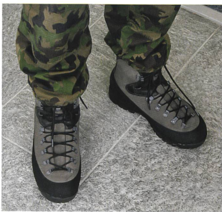
Der neue Kampfstiefel 14.

Allerdings sieht jeder, der die Augen offen hat, den neuen, schmucken Kampfstiefel auf den Waffenplätzen. Wir fragten