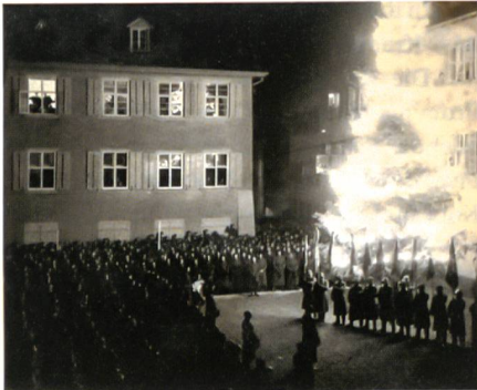
Soldaten-Weihnacht 1944 in Anwesenheit von General Guisan.

2014 interessierte sich eine erfreulich grosse Zahl von nahezu 4000 Besuchern für unsere Ausstellungen, Sammlungen und