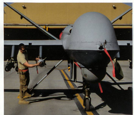
Gehört die Zukunft dem Kampfroboter?