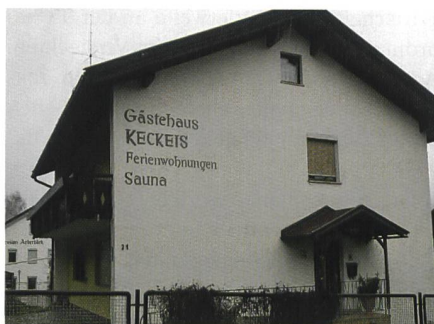
Ein Bild aus Bayrisch-Eisenstein.

Nun zum Bild: Am 15. Dezember 2014 war ich in Tschechien auf der Jagd. Beim Durchstreifen des Grenzdorfes Bayrisch-