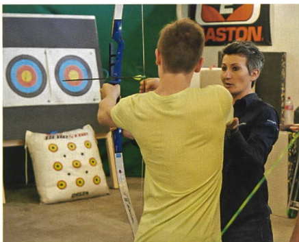
Moderner Bogensport in Luzern.

Die Börse mit ihrem speziellen Ambiente hat nach 40 Jahren nichts an ihrer Popularität eingebüsst. Im In- und Ausland