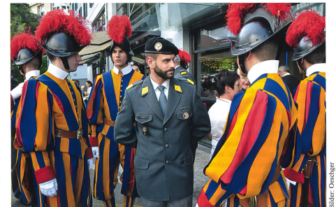
Ein Schweizer in Ausgangsuniform mit Kameraden der Schweizergarde in Galauniform.