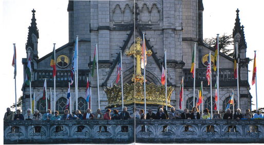
Die Fahnen von 34 Nationen schmückten den Vorplatz der Basilika von Lourdes.

Es wird gemunkelt, dass auch die eine oder andere Liebesgeschichte Armeeübergreifend hier ihren Anfang genommen hat, doch das untersteht dem Seelsorgegeheimnis des schreibenden Asg. ☒