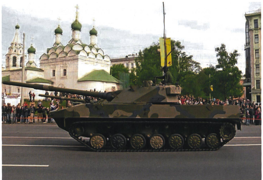
Ihrem Äusseren nach gleicht die Selbstfahrlafette einem gewöhnlichen Panzer.

Ausserdem ist die Sprut-SD mit einem einzigartigen hydropneumatischen Fahrwerk ausgestattet, das es erlaubt, in wege-losem Gelände eine Geschwindigkeit von bis zu 70 Kilometern pro Stunde zu entwickeln. Damit bietet sie Luftlandetruppen bedeutende taktische Vorteile. Überdies kann die Sprut-SD auch stark strömende