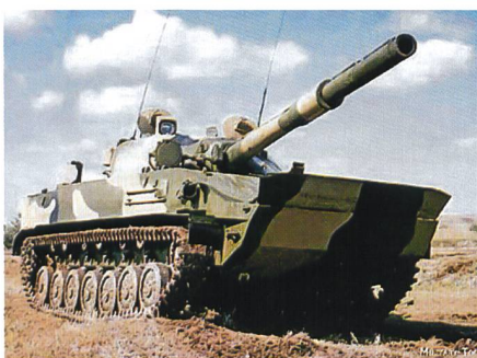
Die Krake Sprut taugt in jedem Gelände.