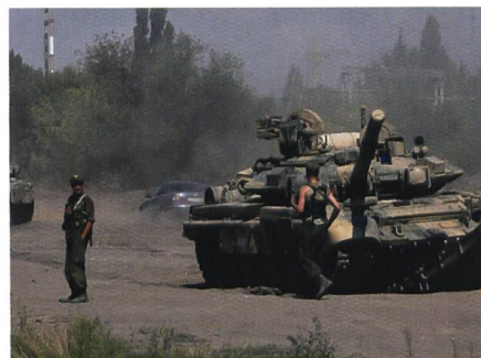
Das neue Bild aus Russland selbst.

In Deutschland spielt mitunter die gute alte soziale Kontrolle. Die Ständige Publikumskonferenz des ZDF reklamierte, worauf der Sender das Bild kleinlaut zu-