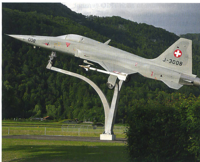
Gateguard (Türwächter) am Flugplatz Meiringen: F-5 Tiger.