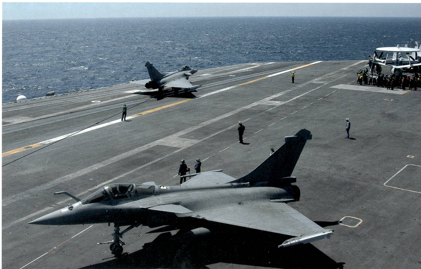
Amerikanisch-französische Kooperation: Zwei Kampfmaschinen des Typs Rafale der Armée de l'air auf einem US-Flugzeugträger.

unter uns Verbündeten ist entscheidend. In der Übung wenden wir genau die gemeinsamen Verfahren an, die im Irak- und Syrien-Einsatz für die Interoperabilität sorgen.»