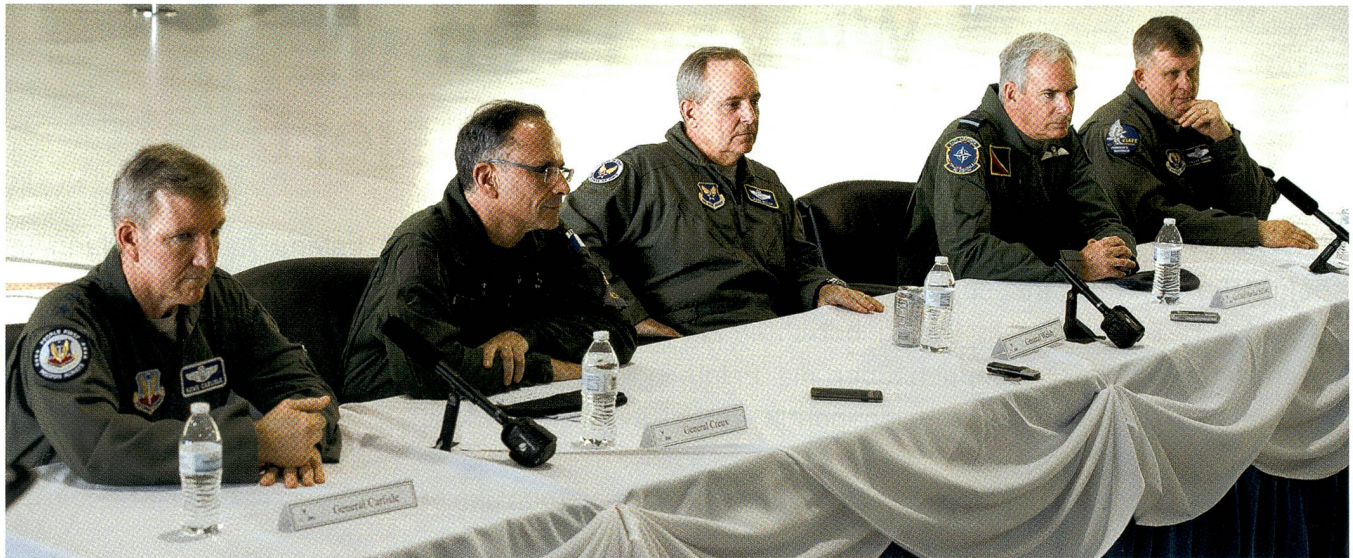
Gen. Carlisle (USAF), General Creux (Armée de l'air), Gen. Welsh (USAF), Air Chief Marshall Pulford (RAF), Gen. Gorenc (USAF).

Die Royal Air Force habe das Cockpit auf den neuesten Stand gebracht, damit es der Typhoon mit Gegnern der fünften Generation aufnehmen könne. Godfrey nannte die russische Allzweckwaffe der Zukunft nicht ausdrücklich; doch muss er an den Suchoi T-50 PAK FA gedacht haben, als er die fünfte Generation nannte.