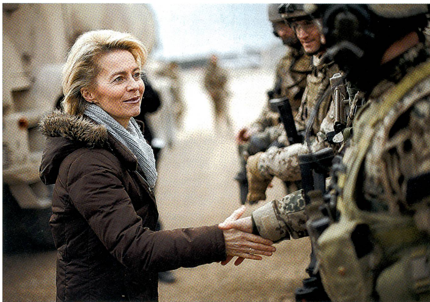
Verteidigungsministerin Ursula von der Leyen besucht oft und gern die Truppe.

Rüstungsprogramm 1984 beschlossenen Kauf von 380 Stück dieses Kampfpanzers keine Zweifel mehr hegte.