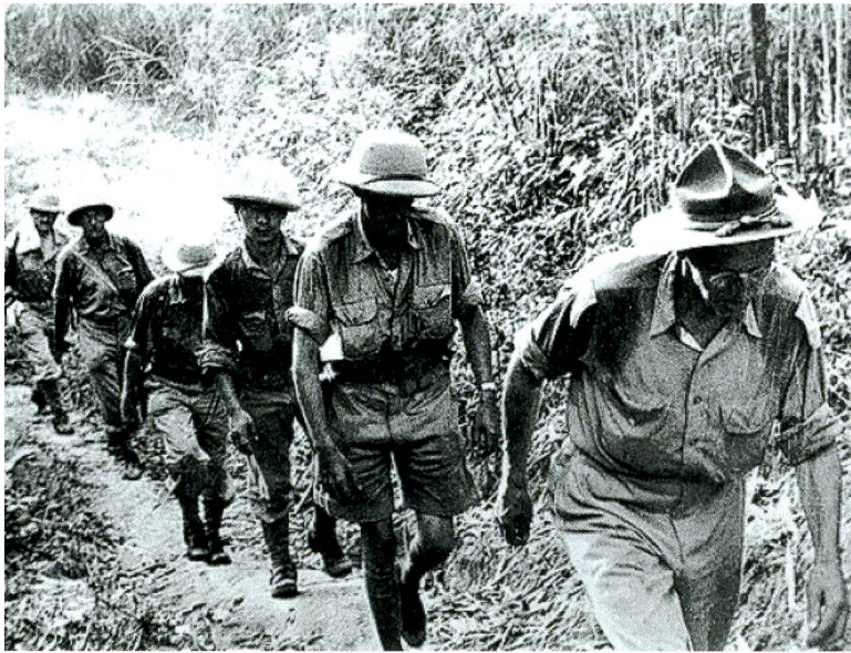
Burma: Alliierte Truppen in beschwerlichem, heissem Aufstieg.