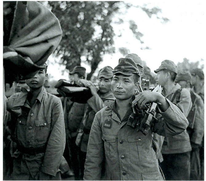
Gefangene Japaner aus der 52. Division nach der Kapitulation.

heit ( Flying Tigers mit P-40-Jägern), die schon vor Pearl Harbor für den Einsatz zugunsten der Chinesen aufgestellt worden war.