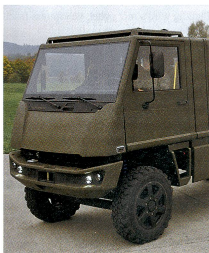
Für die Werterhaltung von 2200 Duro sprach der Ständerat 558 Millionen.

Noch einmal hatte die Tagespresse die Duro-Debatte vor der entscheidenden Sitzung im Ständerat angeheizt.