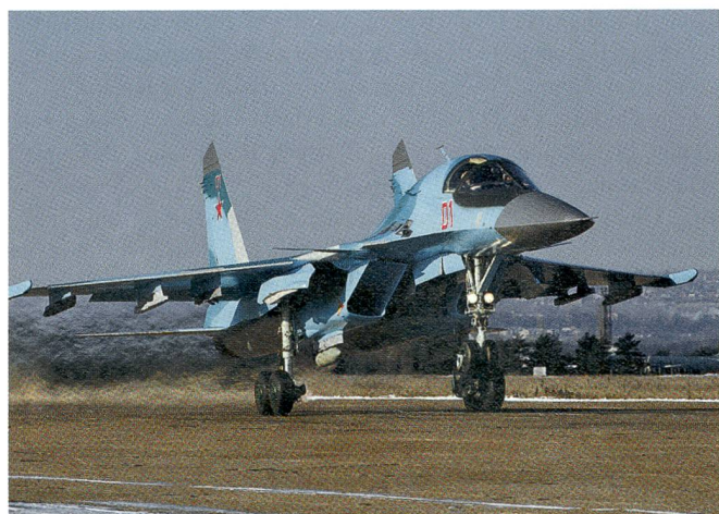
Der Suchoi-34 ist der modernste Russenjet in Syrien.