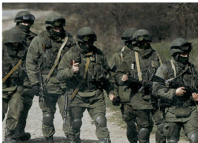
Ohne Hoheitsabzeichen – wie am 1. März 2014 auf der Krim.