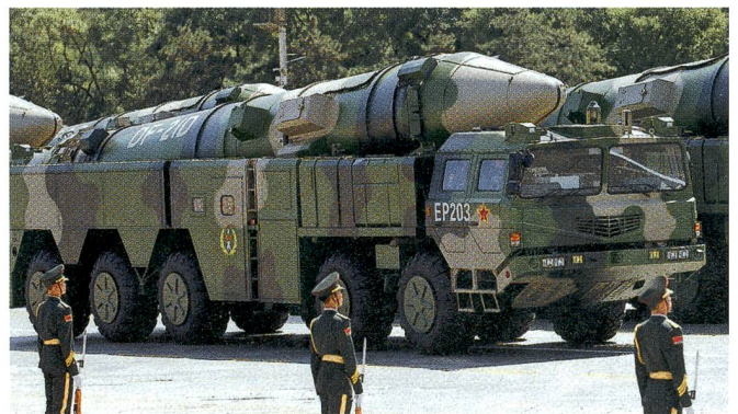
Die ab Land eingesetzte ballistische Rakete des Typs Dongfeng DF-21D, die vor allem für amerikanische Flugzeugträger im Pazifik gefährlich werden könnte.