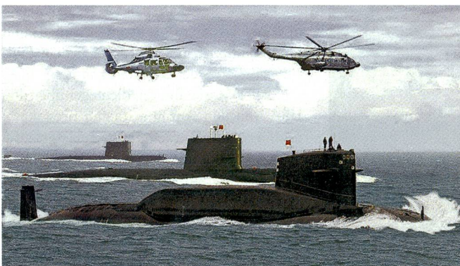
Ein ballistisches Lenkwaffen-U-Boot der Jin-Klasse (Typ 094) PLAN. 2016 soll erstmals eine Einheit dieser Klasse im Indischen Ozean auf Patrouille gehen.