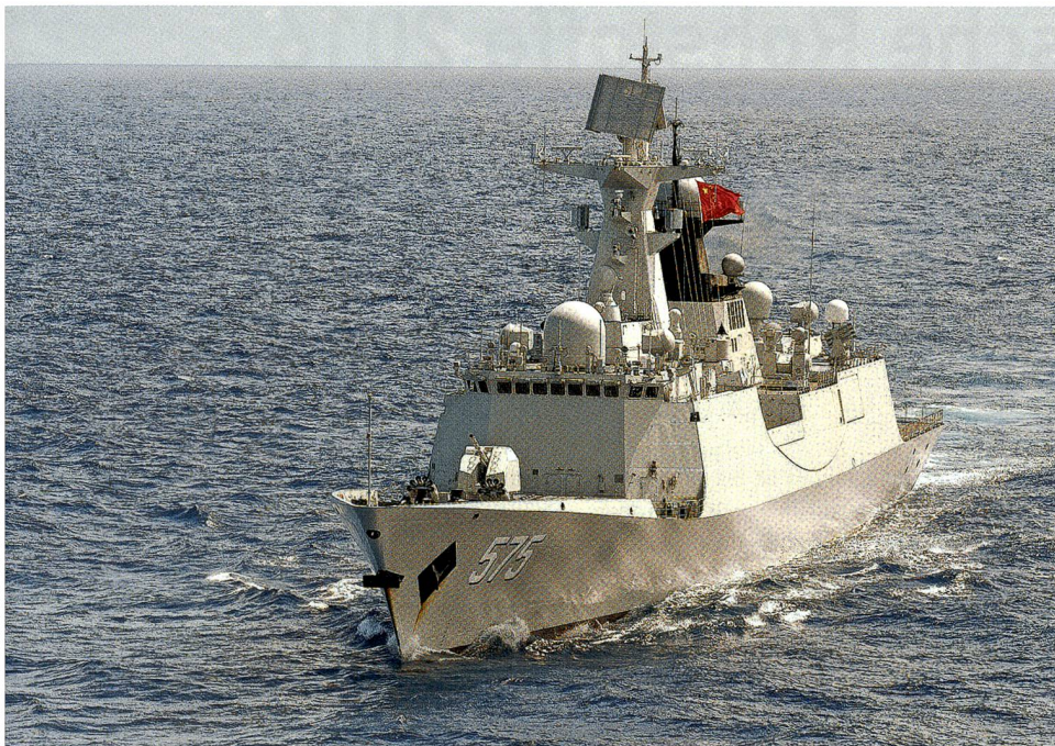
Die moderne chinesische Raketenfregatte Liuzhou (FFG 575) des Typs 054 im Januar 2016 in einer gemeinsamen Übung mit Einheiten der pakistanischen Marine.

wähnte DF-21D besonders bedrohlich sein soll. Die Reaktionen der USA auf das expansive Streben Chinas fallen verhalten aus. Offenbar stehen für sie die wirtschaftlichen Verflechtungen, gar Abhängigkeiten im Vordergrund, die die Obama-Administration nicht gewillt ist, aufs Spiel zu setzen. Man scheint hier die Politik der vollendeten Tatsachen weitgehend zu akzeptieren, setzt auf «Dialog» und «Hoffnung».