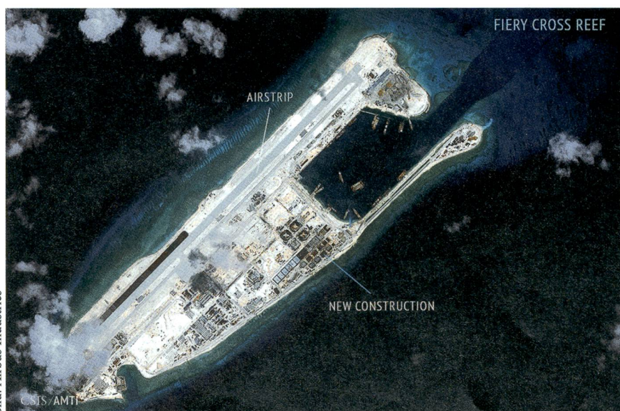
Das zu den Spratlys gehörende Fiery Cross Reef, welches in nur zwei Jahren aufgeschüttet und mit einer 3000-m-Piste versehen wurde. Die Aufnahme zeigt auch die mit Infrastruktureinrichtungen dicht bebaute Insel.

Ein renommiertes sicherheitspolitisches Institut in Singapur spricht davon, dass China sogar künstliche und mobile In-