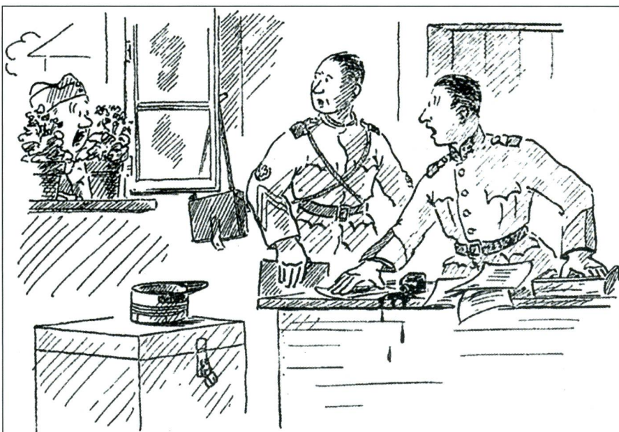
Wachtmeister Rapold: «Herr Hauptme, ich glaube, eusi Brugg isch i d'Luft gfloge!»

Damit ist diese Seite der Angelegenheit erledigt. Jetzt kommen auch die andern aus der Baracke. Etwas hinkend der eine, mit