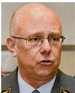
Divisionär Philippe Rebord, Kdt HKA, Jahrgang 1957, Vaudois.