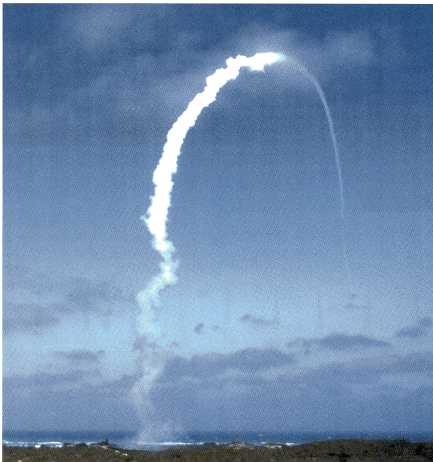
Manchmal machen Fotos Karriere. Dieses Bild ist aus dem SCHWEIZER SOLDAT von der halben Schweizer Presse kopiert worden. Es zeigt die Flugbahn einer IRIS-T SL.

Die grösste Fraktion im Parlament muss ihrem Bundesrat Rückhalt bieten. Die SiK dürfen sich nicht auf die einseitige Pressekampagne verlassen, sondern sollen sich durch die Armee informieren. Denn die SiK müssen hinter dem Projekt stehen. Rasche Entscheide sind geboten, um das Vorhaben doch noch ins RP17 zu bringen.