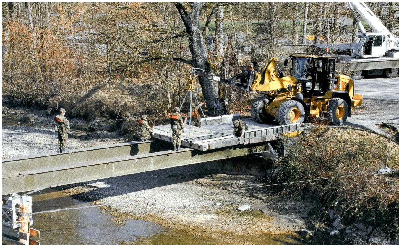
Im Vorfeld ausgeführte Rammarbeiten und die Stahlträgerbrücke waren ganz aus der Nähe zu sehen.

Der vorliegende Text stammt von unserer bewährten Korrespondentin Heidi Bono. Seit langen Jahren berichtet sie für den SCHWEIZER SOLDAT aus der Nordwestschweiz. Die Redaktion freut sich, Heidi Bono mit diesem gelungenen Bildbericht in der Jubiläumsnummer gebührend zu ehren.